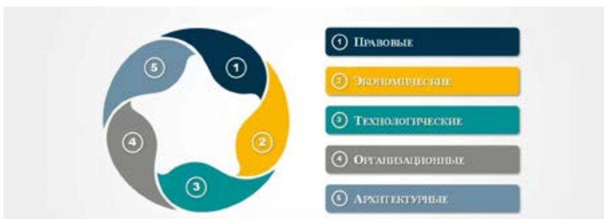
Рис. 4. Меры регулирования выбросов вредных веществ (выполнено автором [7; 8])

Помимо указанных мер, большое значение имеет и усиление государственного и общественного контроля за загрязнением атмосферного воздуха и водных объектов. Одним из вариантов решения этой задачи может стать установка онлайн-газоанализаторов качества атмосферного воздуха на