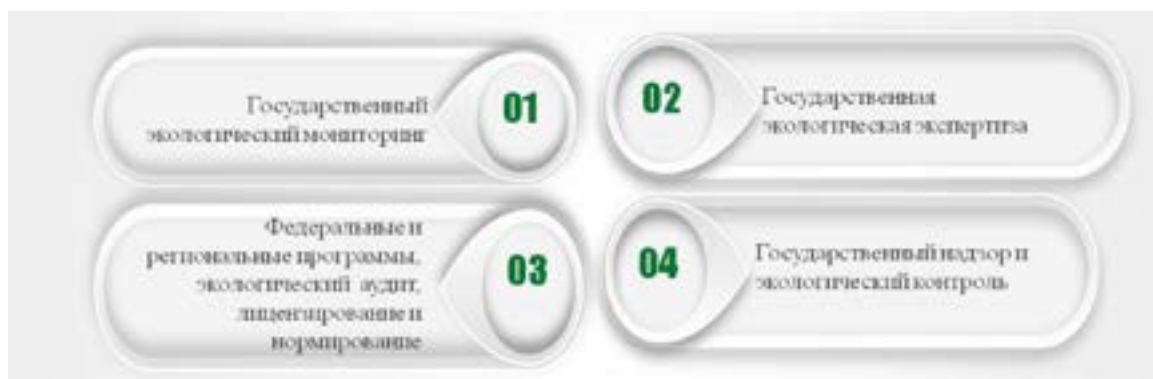
Рис. 3. Группы методов защиты природной среды (выполнено автором [1; 5])

осуществлять надлежащее государственное регулирование и надзор [6].