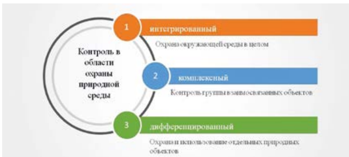
Рис. 2. Виды государственного контроля в области охраны природной среды (выполнено автором [1; 2; 3])

Система органов государственного управления в сфере охраны окружающей среды сформирована, при этом большинство полномочий в сфере регулирования выбросов вредных веществ реализуется на федеральном уровне, что может быть нелогичным и не позволять в полном объеме