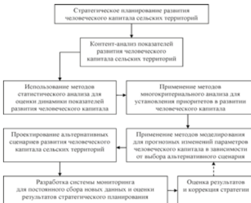
Рис. 1. Алгоритм стратегического планирования развития человеческого капитала сельских территорий

Авторский алгоритм стратегического планирования развития человеческого капитала, применимый к сельским территориям Республики Башкортостан, представлен на рисунке 1.