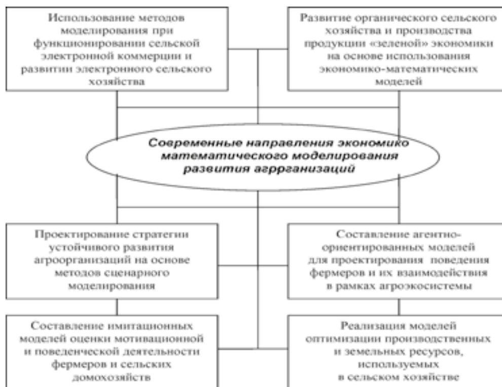
Рис. 1. Современные направления экономико-математического моделирования развития агроорганизаций

вать пространственные и временные аспекты процесса моделирования и повышает